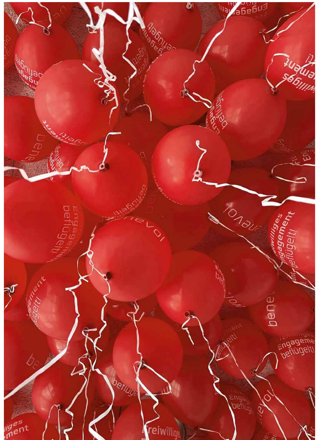
Stimmungsbild vom Tag der offenen Tür am neuen Standort in der Migros Klubschule Aarau.