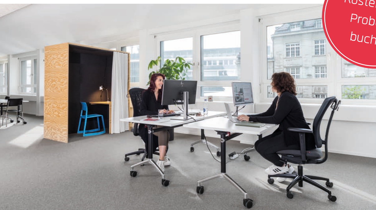
Arbeiten im benevolpark