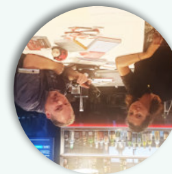
benevol-DATING à Bienne