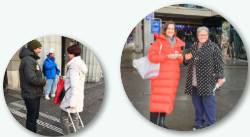
UNO-Tag der Freiwilligen – Verteilaktion Goldtaler