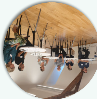
benevol-FORUM bilingue au Generationenhaus

Benevol Kanton de Berne Rue de la Gare 30 2502 Biel/Bienne 032 322 36 16 info@benevol-be.ch www.benevol-be.ch